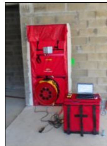
Porte soufflante RETROTEC